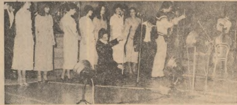
Brigada artistică a Academiei de studii economice — București,