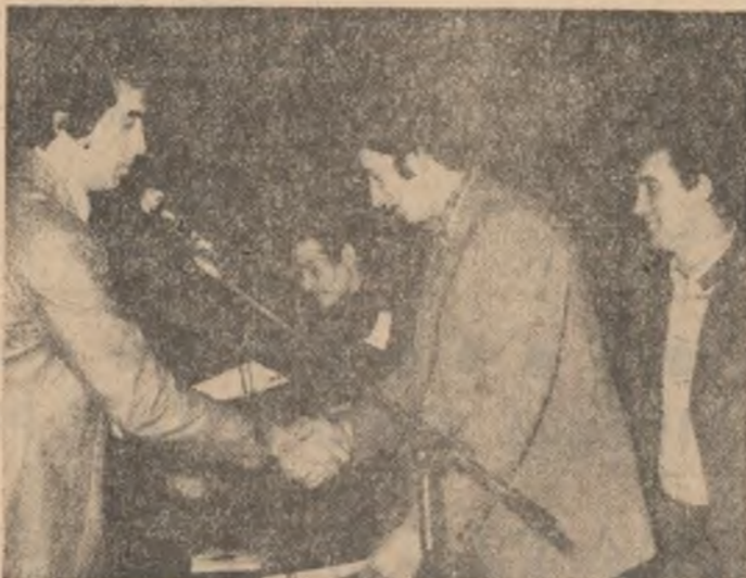
Un moment inedit și impresionant în același timp, al manifestării, care a legat publicul de viața internă, clocoțitoare a marilor șantiere ale patriei, i-a constituit luminarea carnetelor de brigadier și a însignelor de frunțe unor tineri de pe Șantierul național al tineretului de la Combinatul siderurgic Galați. Douzeci de bravi constructori au primit aceste însemne ale muncii și vredniciei, ale înaltului devotament patriotic.