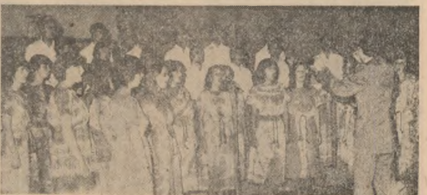
Corul de cameră „Carmen-Juventus” al Clubului tineretului din Galați