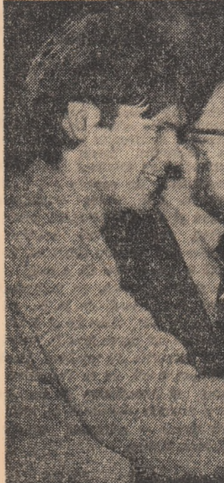
Să ne bucurăm, așadar...

Traseul nostru se intersectează în două puncte (la Revelionul tineretului din Capitală și la „Modern”-club) cu al actorului George Mihăiță, fostul și tineretului și în această noapte dintre ani. De astă dată, risul săntos, „de calitate” pe care-l propoacă stilul său interpretativ (când e vorba de comedie) și are ca mobil un scriu recital de poezie satirică. Profităm de un „respiro” al său și-l întrebăm: — George Mihăiță, ai fost prieten cu „bătrînii” (o vorbă a lui) 1979? — A făcut, o vreme, pe penerosul. — În ce fel ai profitat? — M-am urcat pe scena tea-