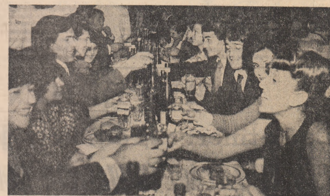
În noaptea de revelion, cea mai cunoscută formă de dialog e toastul