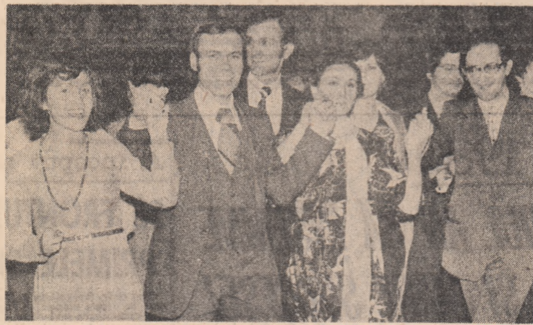
Toată lumea ride, cîntă și dansează (chiar și cei care nu știu)