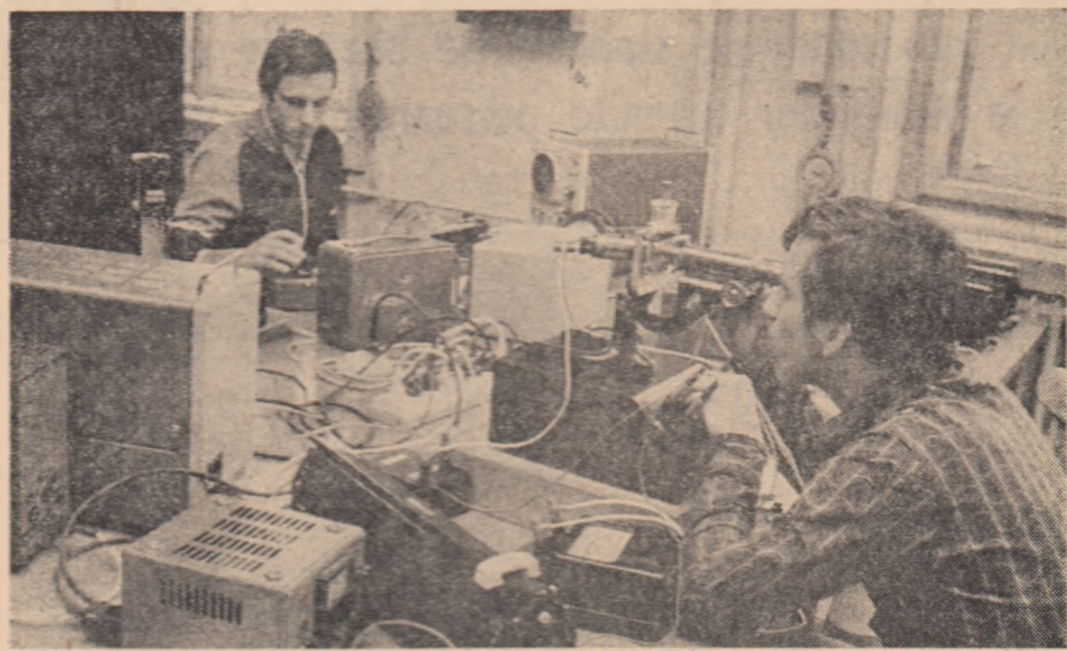
R.S. CEHOSLOVACA — Studenți ai Facultãții de fizicã și matematicã din cadrul Universitãții prognoze, în timpul unei ore de laborator