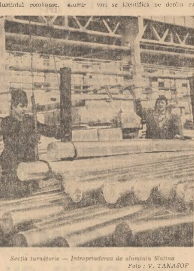
Sectia turnătorie - Întreprinderea de alumina Slatina