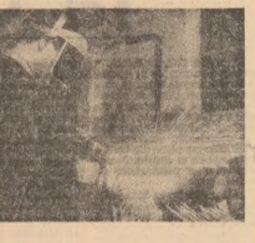
Așa cum metalizarea prin procedeele de la cald contribuie de asemenea la recuperarea altor tipuri de piese.