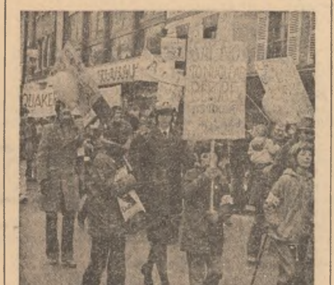
Frontul de luptă pentru apărarea celui mai scump drept al omului, dreptul la viață, pentru încetarea aberanței curse a înarmării, pentru dezmărare și pace reușite în rindurile armelor nucleare. Pe una din pancartele purtate de revoluționarii democrați și progresiști, milioane și milioane de tineri, organizații de tineret de pretutindeni. Fotografia prezintă un aspect din timpul unei mari demonstrații organizate la Cambridge, în Marea Britanie, împotriva proliferării armelor nucleare. Pe una din pancartele purtate de revoluționarii democrați și progresiști, milioane și milioane de tineri, organizații de tineret de pretutindeni.

O primăvară a luptei pentru viață, pentru o existență liberă și demnă