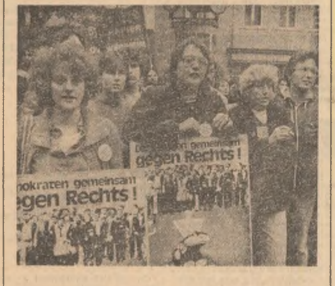
„Democrații împotriva celor de dreptate”, „NU nazismului”, acestea sînt dezlucite sub care miș și miș de tineri din R.F.G. participă la ample acțiuni împotriva re- invierii manifestărilor de violență de tip fascist, împotriva proliferării organizațiilor neozariste.