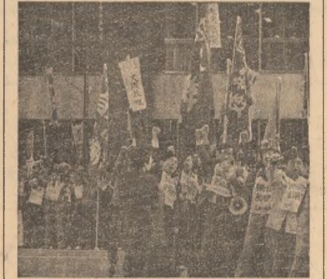
Tînăra generație le, pentru asigurarea se ra dreptului la festafie a tinerilor înscrie ca un factor muncă și învîntură în lupta im-ră, la o existență paniei de primăvară exploatarea liberă și demnă. In ra oamenilor și injustiției socia- imaginea de mai muncii japonezi.

partidul și statul nostru să nu se fi implicat cu responsabilitate, în lumina celei mai pure solidarități cu eforturile și lupta popoarelor, a forțelor revoluționare, democratice și progresiste de pe întreg cuprînsul planetei. O atenție centrală acordă P.C.R. întăririi relațiilor de colaborare și solidaritate cu partidele comuniste din țările socialiste pe baza principiilor deplină egalități în drepturi, respectului independenței și suveranității naționale, neamsecatului în treburile interne și avantajului reciproc, a dreptului fiecărui partid de a-și elabora de sine stătător linia politică, strategia și tactica revoluționară potrivit condițiilor concrete în care își desfășoară activitatea, ale înțelegerii tovarășești și solidarității internaționale. În dezvoltarea și aprofundarea acestor raporturi, un rol hotărîtor au avut întîlnirile și schimburile rodnice de păreri realizate de tovarășul Nicolae Ceaușescu cu secretarii generali sau primii-secretarii al partidelor comuniste sau muncitorești din țările socialiste. Au avut loc de asemenea intense contacte și schimburi de experiență, vizite reciproce de delegații, participarea reciprocă la congrese, la reuniuni și multilaterale, toate acestea contribuind la întărirea prieteniei și colaborării dintre partidele, țările și popoarele noastre, la cauza socialismului și păcii în lumea întreagă. O însemnată deosebită în concepția partidului și sta-