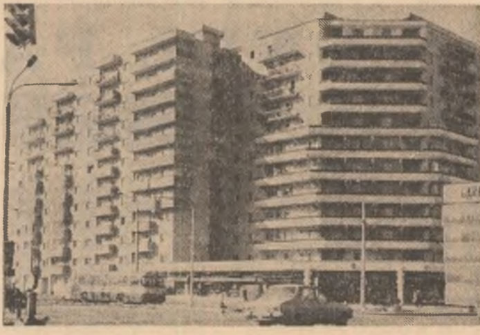
Aspect din cartierul brașovean „Steagul Roșu”