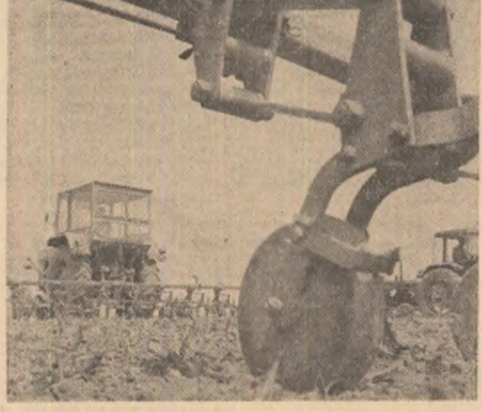
Prăsițul — o lucrare stringentă, de actualitate