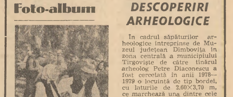
La tradiţionalul tîrg din Târgu Ocrotului