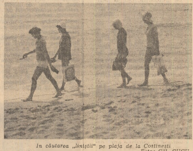
În căutarea „lînştilor” pe plaja de la Costineşti