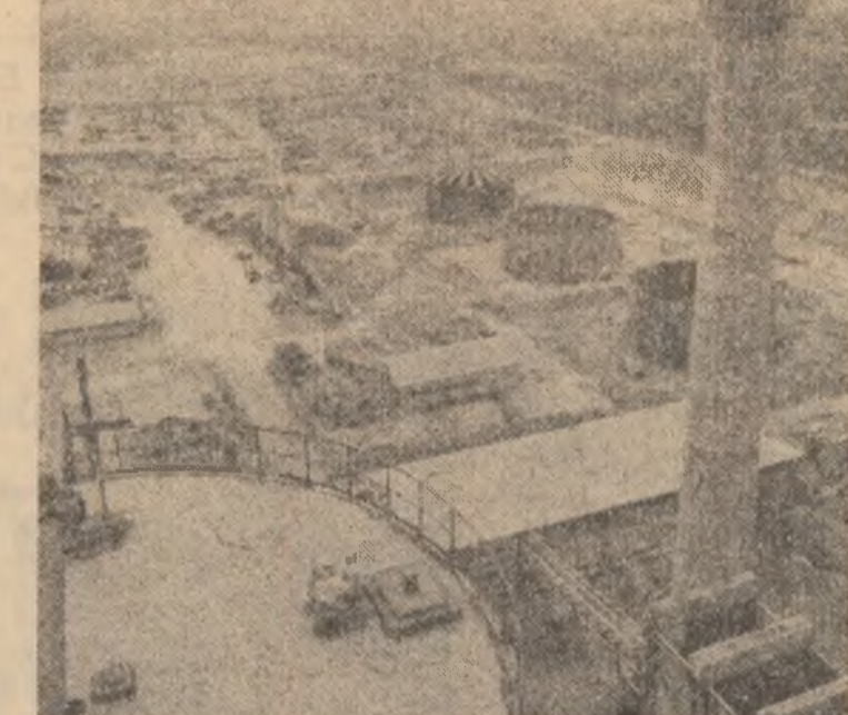
SIRA — Imagine de pe șantierul marii fabrici de ciment de la Sheikh Said, rod al fructuoasei concurențe româno-siriene

„Vizita la Paris — subliniază ziarul — are loc într-o fază deosebit de fertilității politicii externe românești, caracterizată printr-o serie de inițiativă și contacte care — nu permisiu prematur — caracterizează inițiativa președintelui Nicolae Ceaușescu și Valery Giscard d'Estaing. Cotidianul „EL NACIONAL” arată că „în prima zi a vizitei oficiale a președintelui