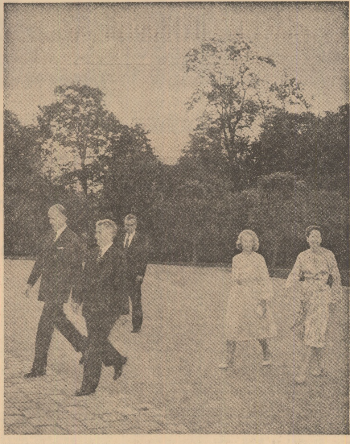
Telegramă de la bordul avionului prezidențial