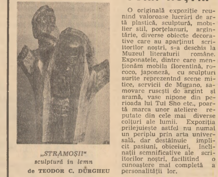
„STRAMOȘII“ sculptură în lemn de TEODOR C. DURGHEU