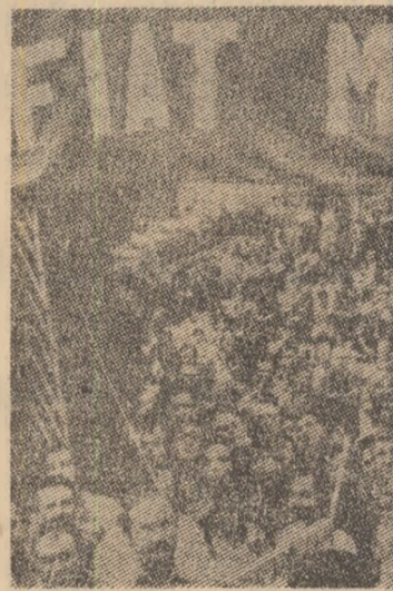
ITALIA: În urma puternicilor greve și acțiunilor de protest, conducerea firmei Fiat a anulat hotărîrea de concediere a 14 000 de lucrători

chis soluțiilor politice în care repartizarea portofoliilor ministeriale și ale funcțiilor-cheie în serviciile publice să se facă „numai pe baza criteriului echilibrului aritmetic între curentele politice”. Comunistii, o spus ei, își vor exprima atitudinea numai în funcție de măsurile concrete pe care noua echipă le va adopta, îndeosebi în domeniile economice și social, în funcție de conținutul programului guvernamental.