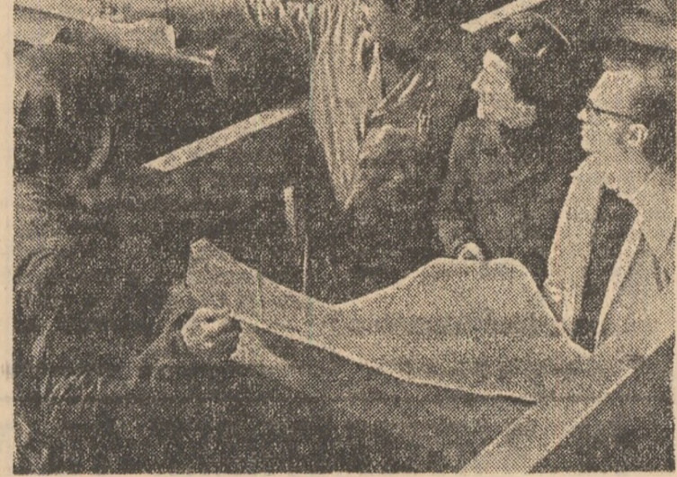
În secția de tratament termic a I.M.G.B., un nou lot de prăjini de foraj la mare adâncime, urmează să fie recepționat

Drumul spre lemnul vîrjii, spre lemnul de mînd, spre mobila noastră de zile zile, nu fine numai de la fabrică spre oameni, ci impune, în primul rând, unul la fel de greu, drumul de la pădure, din hățșuri, spre fabrică de cherestee. Dar oamenii aceia, care-ți poartă spre noi, se numesc, simplu, țapinari.