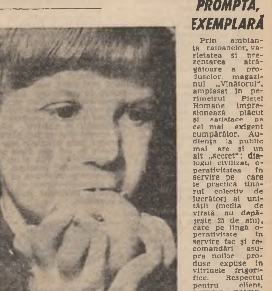
„Mușc din fructul unui timp, Mă presciv cu ciudă meri; Sînt în gură mustul tînăr Stors din gelozia verii”.