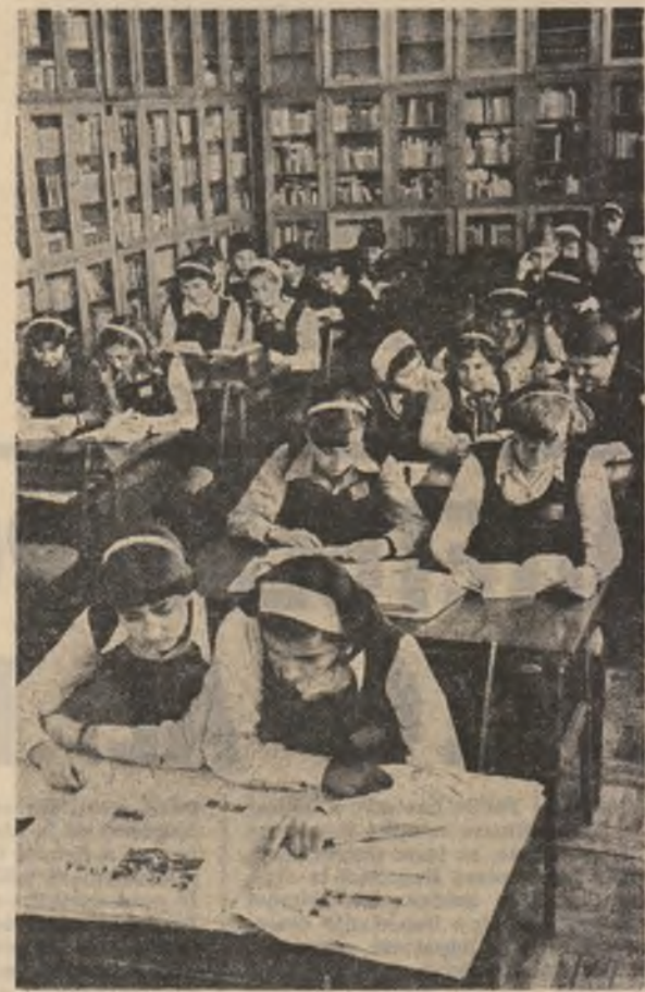
În biblioteca Liceului „Al. I. Cuza” din Focșani

în momentul de față în întreaga întreprindere se lucrează în schimburi prelungește pentru a schimba serioase rămîniți în urmă, în primul rînd la realizarea sarcinilor la export. Normal ar fi fost ca asemenea probleme să își găsească ecoul în cuvîntul reprezentanților organizației U.T.C. în adunarea generală a oamenilor muncii din întreprindere, desfășurată recent. Parcurînd acest cuvînt nu am putut descoperi nici o cifră concretă, nici un punct de vedere critic și autentic argumentat, ci numai o colecție de fraze generale, de angajamente bine intenționate, valabile însă oriunde și oriunde. Mai este atunci întâmplător faptul că angajamentul pentru 1981 al or-