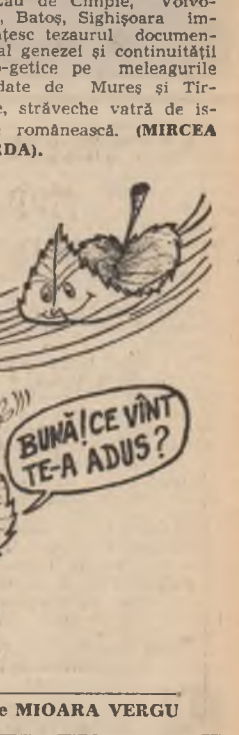
Rubrică realizată de MIOARA VERGU

Specialiștii Muzeului de istorie al județului Mureș în colaborare cu Muzeul de istorie al Transilvaniei continuă cercetările arheologice din zona castrului roman de la Brincoveni, important centru militar și de civilizație romană. Materialele descoperite aici, în vara acestui an, cu și cele descoperite pe șantierul arheologic de la Zău de Cîmpie, Votvodeni, Batoș, Sighișoara imbobogătesc tezaurul documentar al genezei și continuității daco-gețice pe meleagurile scaldate de Mureș și Tîrnava, străveche vatră de istorie românească. (MIRCEA BORDA).