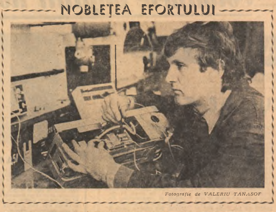
SĂ DISCUTĂM DESPRE TINEREȚE, EDUCATIE, RĂSPUNDERI

plata consta într-un echipament de protecție: salopetă, bocanci etc. și oamenii erau fericiți.