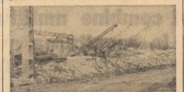
Nu există suficiente mijloace? Pe lângă pătulele care stau goale are și un câmp de cultură în cooperativă din Crețești, o postă ajunge cu oportunitate în baza de recepție, unde nu-i așteaptă, așa cum am văzut, o soartă mai bună.