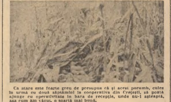
Ca stare este foarte greu de precupus că și acest porumb, cules în timpul ce două săptămîni la cooperativă din Crețești, o postă ajunge cu oportunitate în baza de recepție, unde nu-i așteaptă, așa cum am văzut, o soartă mai bună.