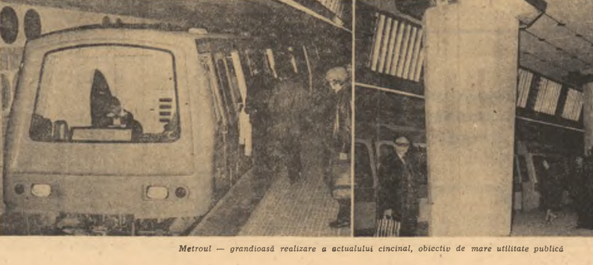
Metroul - grandioasă realizare a actualului cincinal, obiectiv de mare utilitate publică

O FERICIRE DURABILĂ, CA INIMA UNUI BARAJ (Continuare în pag. a 11-a)