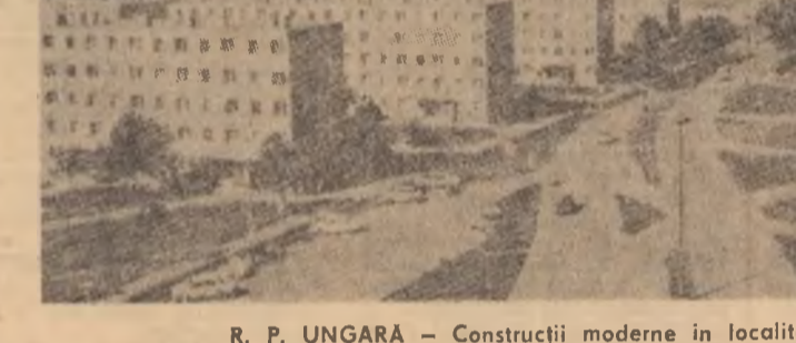
R. P. UNGARA — Construcții moderne în localitatea Dunavnyóvros

La rândul lor, autoritățile guvernamentale au informat că ele controlează situația în întreaga țară, cu excepția zonei orășului Metapan, situat la 122 km nord-vest de San Salvador, și că un calm relativ domnește în 70 la sută din teritoriul național.