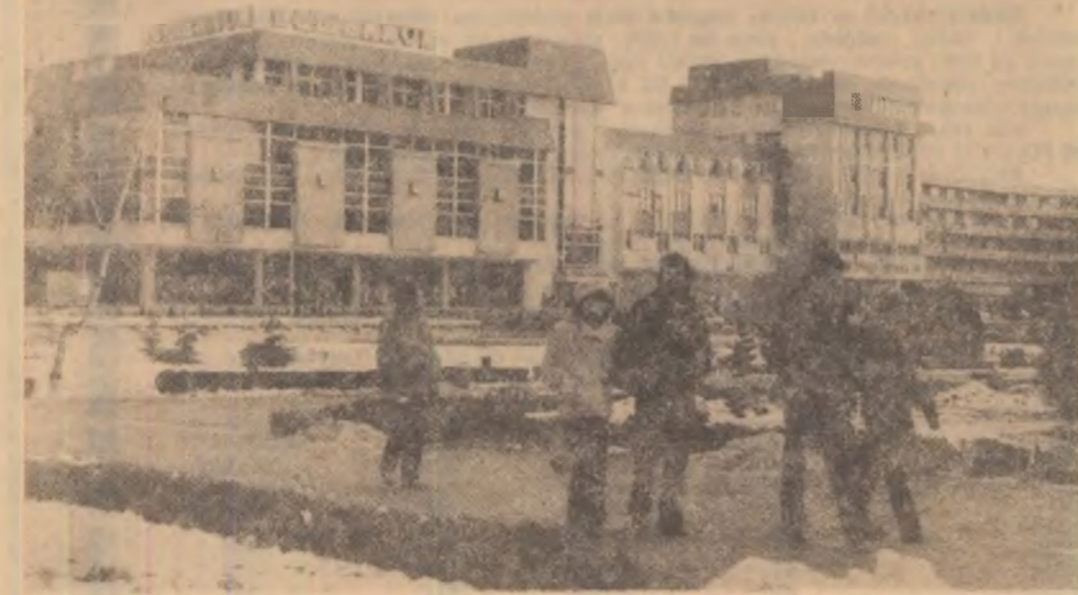
Alături de vechile clădiri cu arhitectura caracteristică, sîmbul își aliniază obiectivele moderne, îmbogățindu-și, an de an, zestrea edilitară.