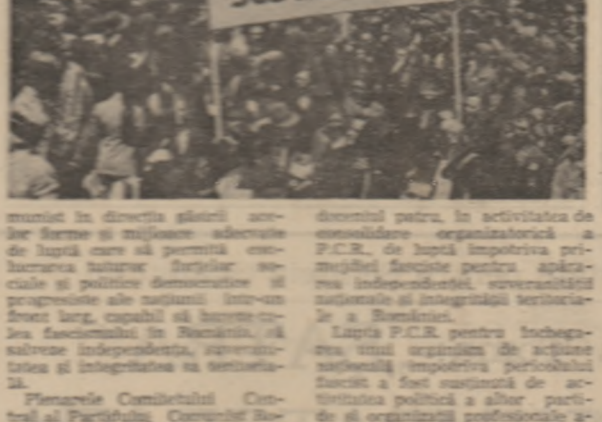
Fotografie Comitetului Central al Partidului Comunist Român...