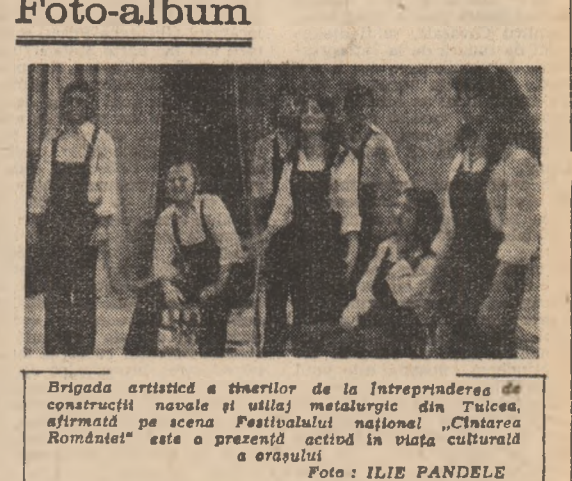
Brigada artistică a tinerilor de la Întreprinderea de construcții navele și utilaj metalurgic din Tulcea...