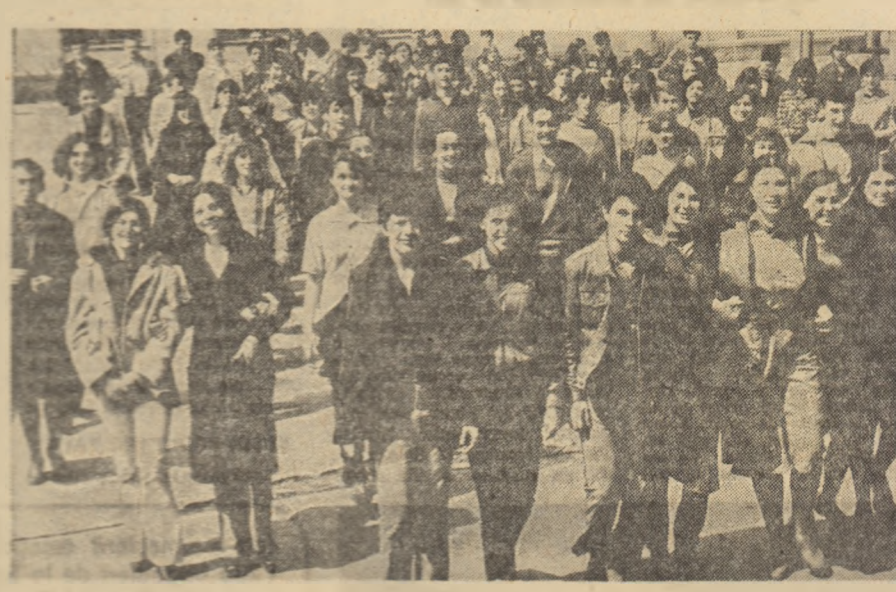
Ați citit? Aveți cuvintul!

Despre publicarea in ziarul nostru a unei anchete asupra cazului dramatic al Lidiei G., victima a unor practici obscurantiste a fanatismului, abuz al voii în care libertate de diverse profesii, din toate colturile țării, și exprimate sentimentele lor față de cazul relatat.