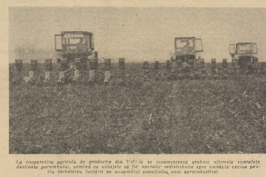
La cooperativa agricolă de producție din Videle se însoțesc grăbnic ultimele suprafețe destinate porumbului...