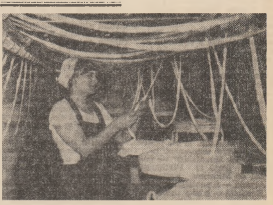
Prin mina harnicelor fete de la Filatura de bumbac Sibozia firele își dobîndesc înalta calitate solicitată.