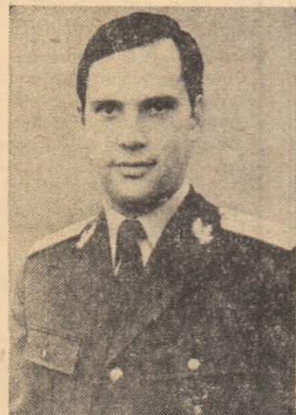
Lt. major DUMITRU PRUNARIU cosmonaut cercetător

mandantul navei, Leonid Popov, Erou al Uniunii Sovietice, pilot cosmonaut, și Dumitru Prunariu, cosmonaut cercetător, cetățean al Republicii Socialiste România.