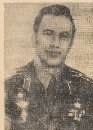
LEONID POPOV pilot cosmonaut

Programul zborului navei „Soiuz 40” prevede cuplarea cu complexul științific orbital „Saliut 6” — „Soiuz 74”. Cosmonauții Popov și Prunariu vor efectua la bordul complexului o serie de cercetări și experimente împreună cu cosmonauții Kovalionok și Savinîh, care se află pe o orbită circumferențială de la 12 martie 1981.