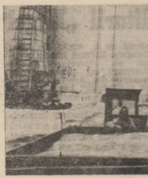
La bazele de recepție o permanentă stare de activitate pentru preluarea operativă și integrată a recoltării din cîmp