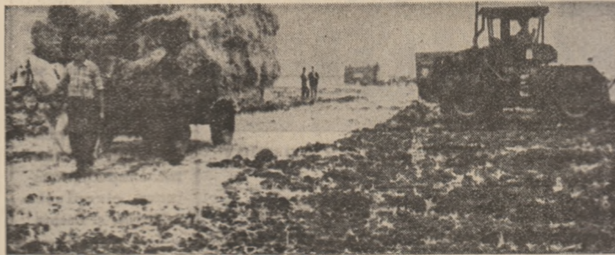
Imediat după recoltarea orzului în Bărgăneț s-a trecut la eliberarea terenului și înămînțatul celui de a doua cultură