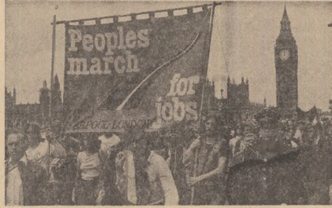
MAREA BRITANIE — Aspect de la o puternică demonstrație împotriva șomajului, desfășurată la începutul acestei veri, la Londra

OTTAWA 7 (Agerpres). — Comunitatea Economică (vest)-Europeană consideră că este important ca la viitoarea reuniune la nivel înalt a principalelor state occidentale industrializate, care va avea loc la Ottawa, participării să-și asume un nou și puternic angajament de a sprijini un comerț liber și de a combate protecționismul, a declarat Wilhelm Haferkamp, vicepreședinte al Comisiei C.E.E. Pe de altă parte, un alt punct important ale agenției reuniunii de la Ottawa vor fi dialogul Nord-Sud, precum și politica S.U.A. în domeniul dobinzilor, politica menită să stopeze inflația în Statele Unite dar care, după cum a subliniat el, are ca efect în Europa occidentală creșterea șomajului și scăderea activității de investiții.