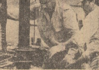
MEXIC: Muncitori mexicani la una din exploatarea de țitei, o mare bogăție a țării

Într-o conferință de presă desfășurată la Casa Albă, după aprobarea de către Congres a bugetului pe anul fiscal 1982, ministrul de finanțe al Statelor Unite, Donald Reagan, a declarat că va fi nevoie de un interval de 9 până la 12 luni pentru ca să se vadă primele rezultate ale noii politici economice preconizate de Administrația republicană. SINDICATUL SALARIAȚILOR DIN SISTEMUL FINANCIAR DE STAT DIN ISRAEL a hotărât intensificarea acțiunilor greviste.