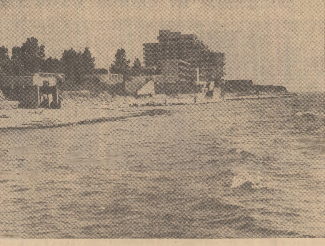
Imagine din Costinești