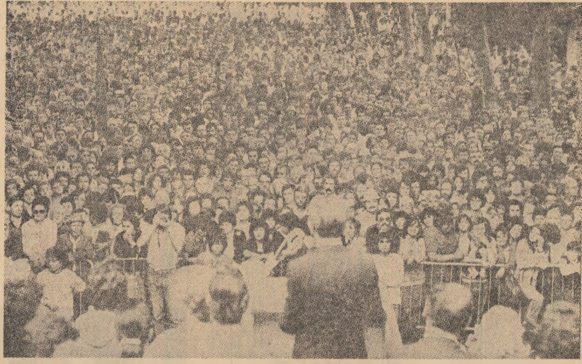
ITALIA: Aspect din timpul unei ample manifestații organizate de comuniștii italieni în orașul Veneția în sprijinul revendicărilor economice și sociale ale oamenilor muncii

PARLAMENTUL ITALIAN a adoptat o lege privind reforma legislației presei, care vizează evitarea unei concentrări prea mari a publicațiilor în mâinile unei singure persoane. În baza noii lege, nici un editor nu va avea dreptul să dețină mai mult de 25 la sută din tirajul global al cotidianelor.