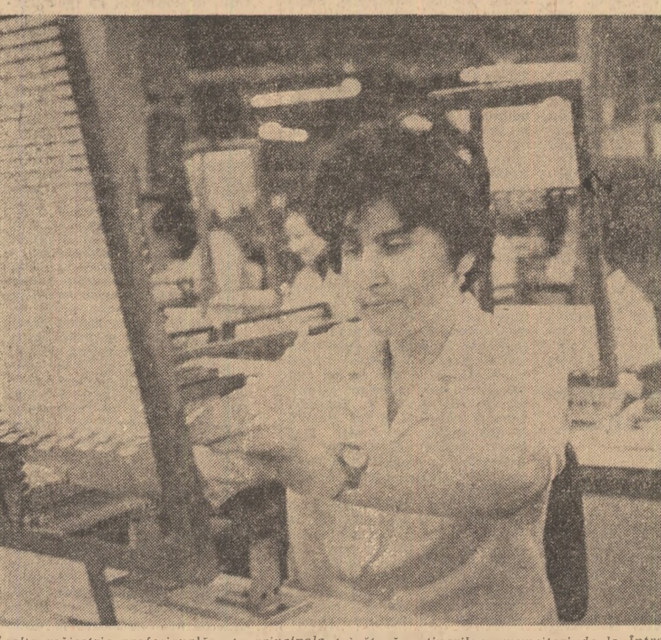
Înaltă măiestrie profesională este principala trăsătură a tinerilor muncitori de la Întreprinderea de produse electronice și electrotehnice „Electroorges” din Gurtea, Argeș.

Cine macină timpul la Slobozia Moară ? Se terminase stringerea grului și orzulul la C.A.P. Slobozia Moară, județul Dimbovița. Greutățile recoltării le-au învins ajutama de cei de la Consiliul unic agro-industrial Târâșești care le-au trimis încă 6 combine. Atunci, au stat toți pe cîmp și cele 22 ha cu grâu și 150 ha cu orz au fost recoltate. Doar că, pe ici pe colo, terenul nu a fost încă eliberat. Singura mașină de balot stă pe undeva, fără să funcționeze iar mecanizatorii stau și ei grămadă la sediul cooperativei, așteptînd vreun „mai uscate” ca să poată ieși în cîmp. Ploaia, care aduse bucurie întregului sat, le anihilează orice dorință de muncă ? Șeful