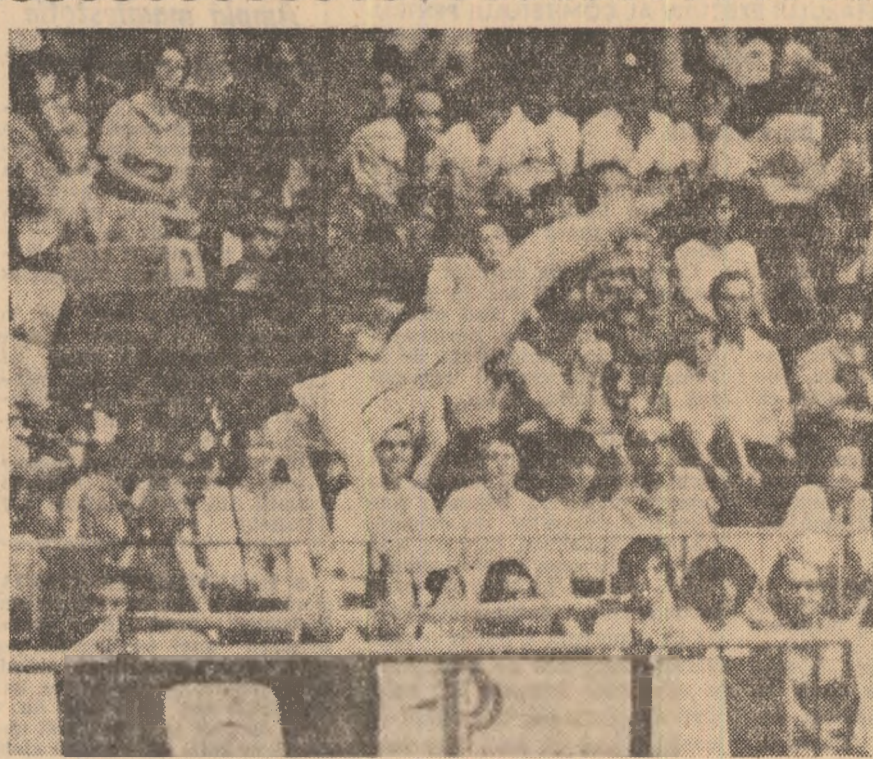
Nadia Comăneci la paralele