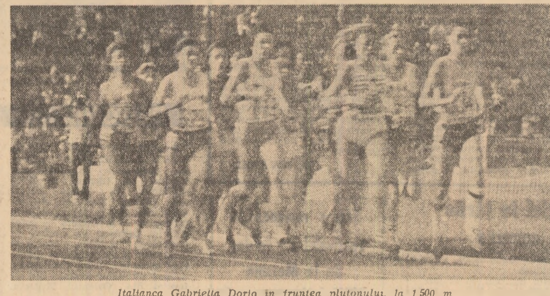
Italianca Gabriella Dorio în fruntea plutonului, la 1500 m