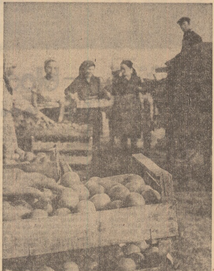
grafic de livrare a castraveților, cepei, tomatoilor, este meritul tuturor celor peste 100 de elevi și cooperatori prezenți în grădina de câmpuri și fața ziă piină după ce se întorc.

Mii de locuitorii ai satelor, mecanizatori și cooperatori, sute de tineri, participă la adunatul recoltei.