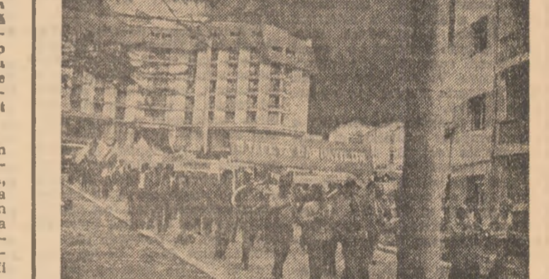
Acțiunea de drumeție și orientare turistică „Stafeta Carpaților”, organizată de B.T.T., s-a încheiat, după două luni, parcursă peste 1500 km...