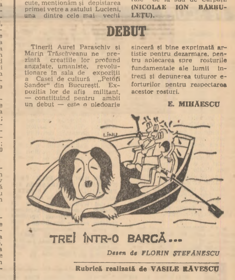
TREI ÎNTR-O BARCĂ... Desen de FLORIN ȘTEFĂNESCU