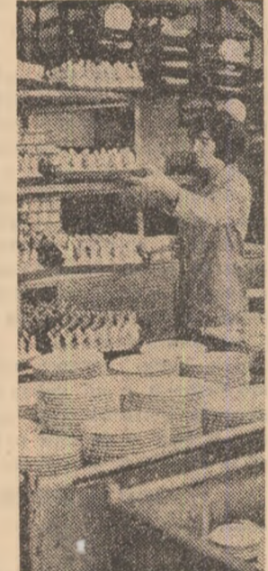
Un nou lot de produse, destinat exportului, este pregătit pentru livrare la întreprinderea de portelan menaj din Curtea de Argeș.