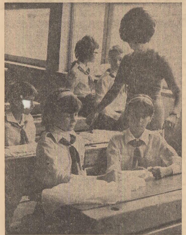
Din nou în bănci...

Preluarea recoltei — cu operativitate și răspundere!