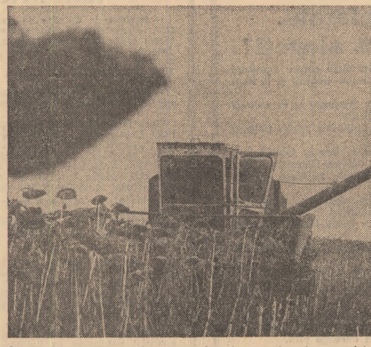
Se recoltează intens floarea-soarelui de pe ultimele suprafețe la I.A.S. Slobozia