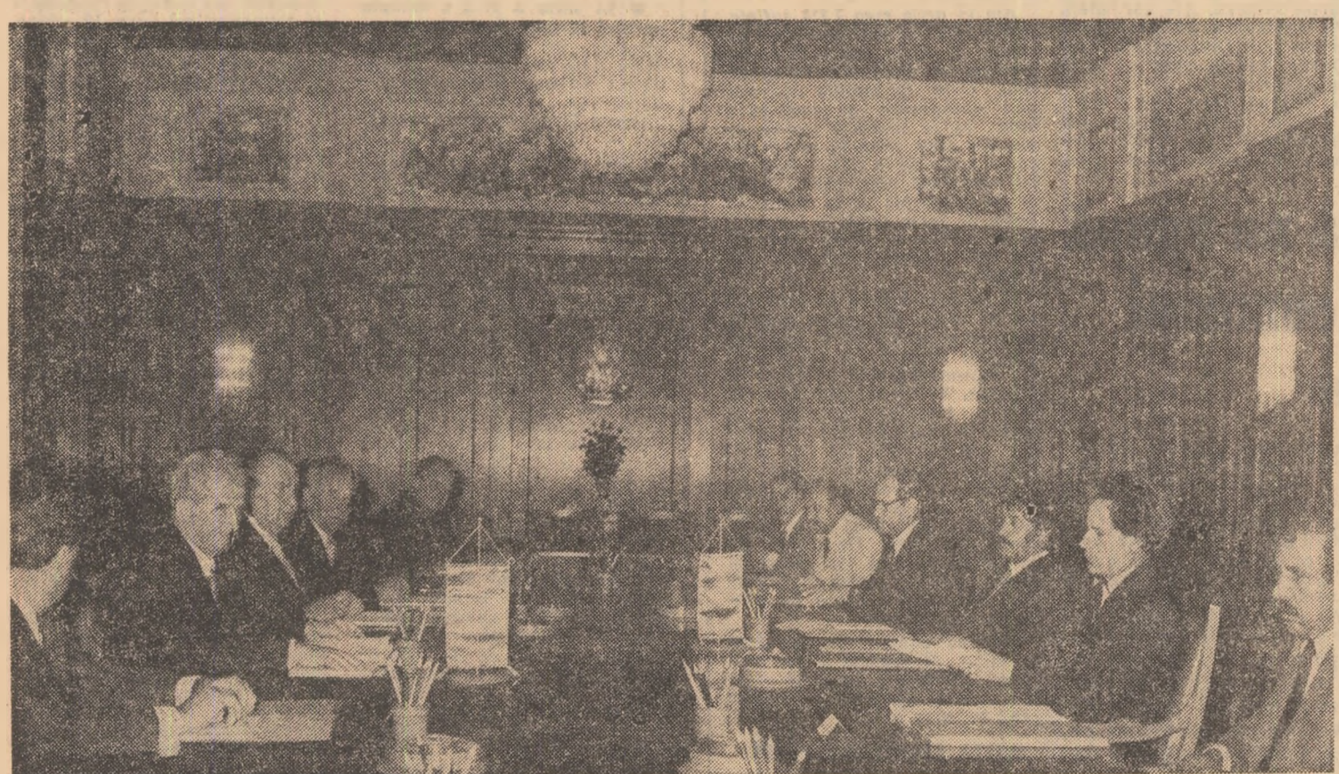
În timpul convorbirilor oficiale

Președintele Nicolae Ceaușescu și colonelul Moammer El Geddafi au subliniat în mod deosebit că în perioada care s-a scurs de la precedentul dialog la nivel înalt româno-libian din 1979, de la Benghazi, relațiile dintre cele două țări au cunoscut o dezvoltare continuă, pe baza respectului independent și suveranității naționale, egalității în drepturi și avantajului reciproc, neamestecului în treburile interne. În acest context, au fost relevate cu satisfacție acțiunile întreprinse, în baza înțelegerii convenite, pentru extinderea cooperării economice, tehnico-științifice și culturale, precum și a schimburilor comerciale dintre cele două țări, în folosul dezvoltării economice