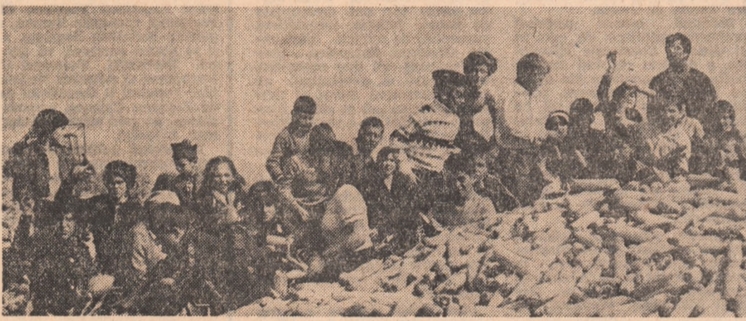
Elevii din imagine, prezenți la depășitul și încărcatul porumbului în camion pe una din taratele I.A.S. Ogradă, sint numai o parte din cei 25.340 elevi care în județul Ialomița aduc o contribuție hotărâtoare la stringerea roadelor toamnei. Zilnic, prin miștile elevilor ialomițeni trec o cantitate de circa 7.100 tone porumb. Nu este, deci, întimplător că unitățile agricole aplează la elevi. Nu întimplător este nici obținerea unor asemenea rezultate, pentru că,

urmărindu-i la lucru își dai seama că ei și-au luat în serios sarcinile. Nu puțin dintre cei ce sint în aceste zile prezenți pe ogoare sint fiili cooperatoriilor care au obținut recoltele bogate, cu care județul se mîndrește. Iar colegii lor de la oraș nu puteau rămîne mai prejos, această întrecere fiind în beneficiul nostru, al tuturor. Și poate că peste nu multă vreme, mulți dintre acești copii se vor afla și în fruntea unităților agricole care fac jaima Bărganului ialomițean.