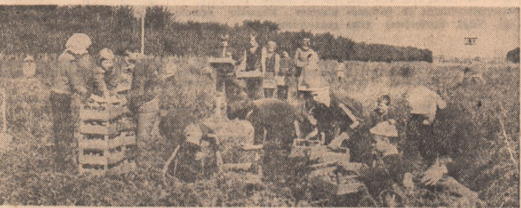
Grupaj realizat de ȘTEFAN DORGOȘAN și ALEXANDRU STROE