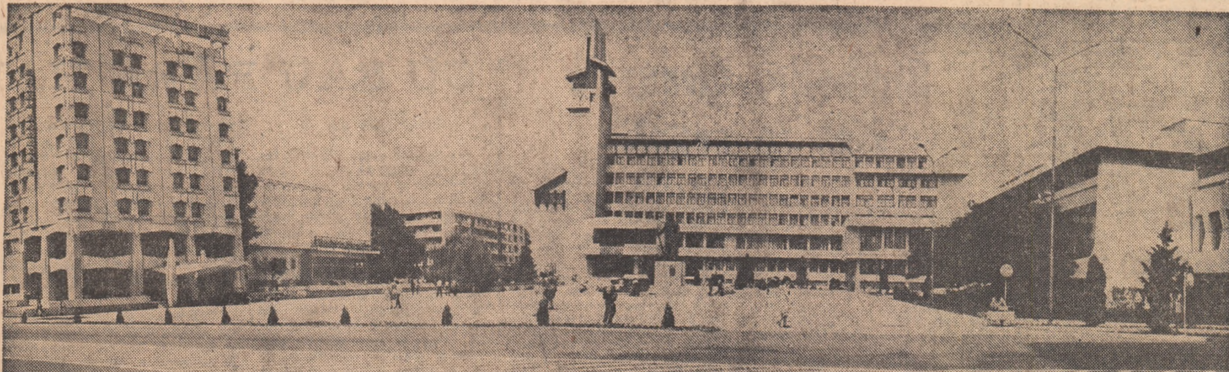
Noul și impresionantul centru civic al municipiului Vaslui