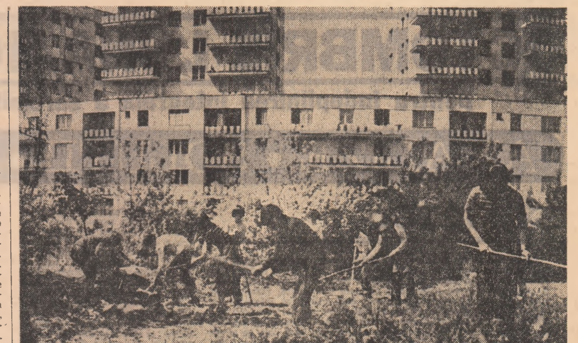
Toamna a dat de lucru micilor gospodari ai noului cartier Dărmănești din Piatra Neamț