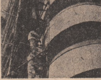
Mestrierii Craiovei se înalță înălțind orașul