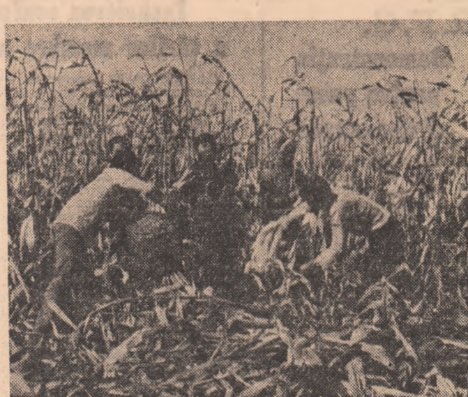
Un careu de neuitat

De ce se staționează cind timpul este numai bun de lucru? — Combina pentru porumb a sosit ieri să se schimbe vultul, iar celelalte astăzi. Nu mai au motorină. Dealtfel nu stau. Se fac mici remedieri.