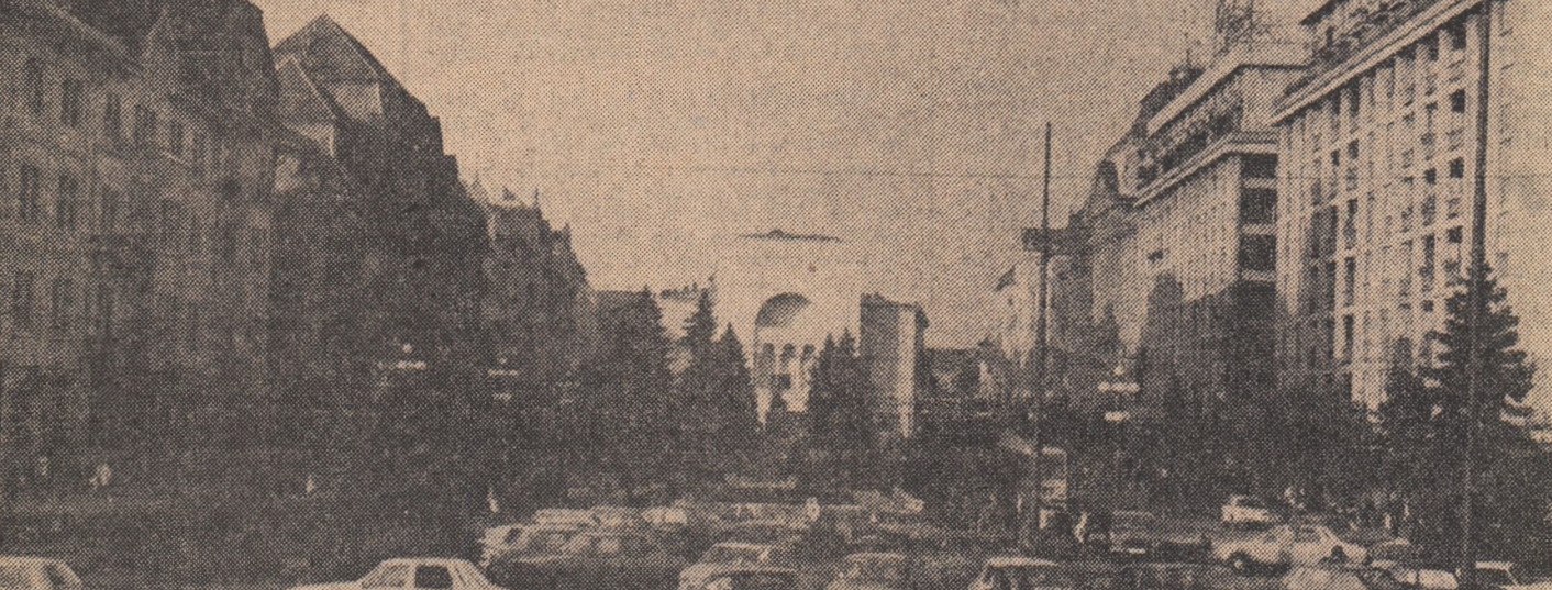
Piața Operei din Timișoara — materializare a preocupărilor edililor orașului de a integra noile construcții în ansamblul arhitectonic specific.

Probleme privind EXPORTUL („Electromagnetica” București), INVESTIȚIILE (șantierul întreprinderii de industrializare a steclei de zahăr — Ianca), PRODUCTIVITATEA MUNCII (industria șirnet Cîmpia Turzii) și PRODUCTIA FIZICĂ (I.M.U.C. București) — în pagina 3-a