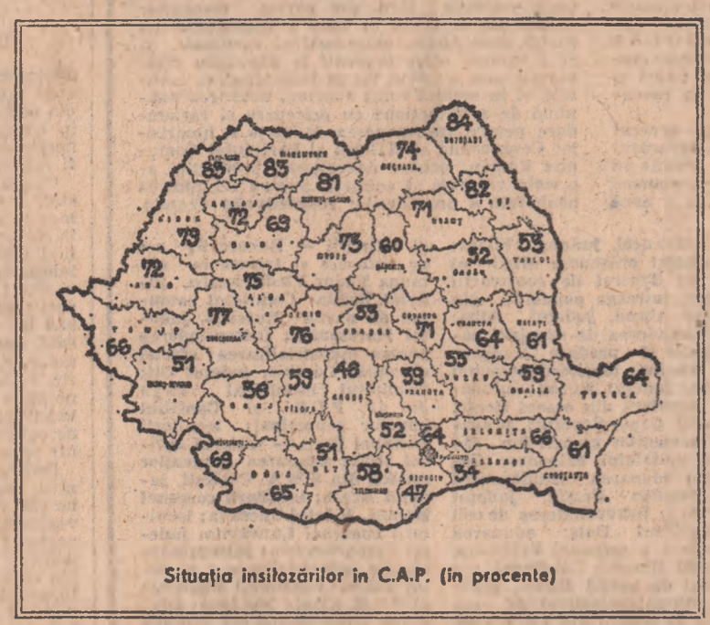
Situația insilozării în C.A.P. (în procente)