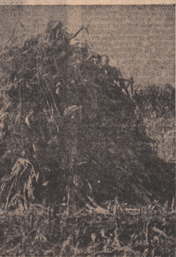
(fin, lucernă) sînt în cantități insuficiente. Se impun, deci, măsuri hotărîte, atît aici, cit și la I.A.S. Smîrdan pentru a se strînge cit mai repede de pe cîmp tot ce poate constitui hrană pentru animale. Furajele pentru sec-

parcul de furaje, ne spune dumnealui, 1.500 tone paie, 1.200 tone siloz, 200 tone fin, și în cîmp încă 32 ha cu lucernă, deci cam 400 tone pe care trebuie să le recoltăm”. Tot în cîmp sînt și coceni, adunați în glugă, ne asigură tovarășul președinte. Desigur străduința conducerii acestei cooperative pentru asigurarea furajelor necesare în sectorul zootehnic, care își realizează planul în proporție de 88 la sută la lapte) nu poate fi negată. Pe lângă cantitățile amintite, C.A.P. Smîrdan primește zilnic 10 tone borbot de la Fabrica de bere din Galați, ceea ce constituie, bineînțeles, o hrană bună pentru vacile cu lapte. S-au luat, totodată, măsuri pentru introducerea în siloz a tulpinilor de floarea-soarelui, s-au adus 300 tone paie de soia de la I.A.S. Tulucești etc. Atîta timp însă cit cantități impresionante de coceni se află încă în cîmp, neînsilozate, nu se poate spune că s-a făcut totul. Cu atît mai mult cu cit furajele de calitate