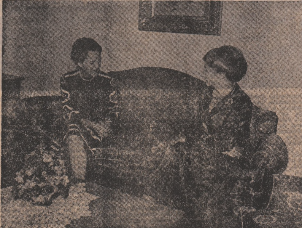
Joi, tovarăsa Elena Ceaușescu s-a întâlnit cu doamna Veronica Carstens. În cursul întrevierii, doamna Veronica Carstens a împărtășit

lăcaș de cultură și i-a invitat pe oaspeți să viziteze săliile cuprinzând bogate colecții de artă, reprezentând practic toate genurile — pictură, sculptură, grafică, artă decorativă etc. S-a arătat că prin investițiile substanțiale făcute de statul nostru, Muzeul Bruckenthal a devenit una dintre cele mai importante instituții de cultură și cercetare științifică și artistică.