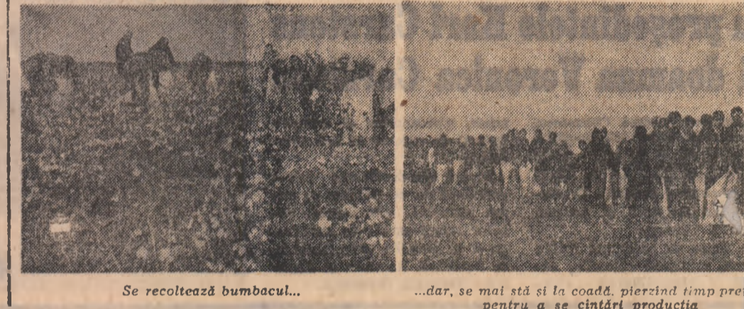
Se recoltează bumbaucul... dar, se mai stă și la coadă, pierzînd timp pentru a se cîntări producția