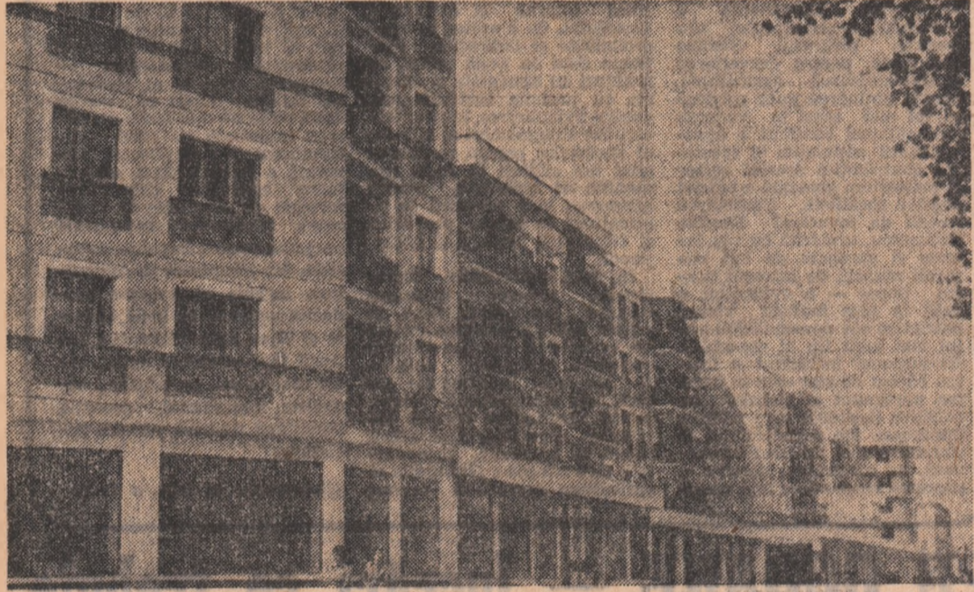
Topoloveni — județul Argeș

Comentariul cu stringerea de pe cîmp a ultimelor produse de urze ale lucrărilor agoarelor prahovene, buzoiene și dimbovitene pregăsite recolta anulului viitor în acest scop, în toate activitățile agricole de stat și cooperative echipe specializate eliberate tenurile de restituire a terenurilor pe care s-au lucrat pentru furaje, iar în urma lor mecanizatori — aproape jumătate din numărul organizațiilor și în schimburi de noapte — întore brazda pentru înșămîntările din primăvara... Efortul lor se concretizează, deasfîl, zilnic în efectuarea arăturilor pe mai bine de 5 000 ha, suprafață ce depășește viteza de lucru stabilită — creîndu-se astfel premise pentru încheierea acestor lucrări pînă la sfîrșitul săptămînilor în curs pe toate cele aproape 200 000 ha planificate în cele trei județe. O amplitud și susținută activitate se desfășoară în aceste zile de vîrt ale campaniei de prelucrare a sticlei de zahăr și la fabricile de zahăr din Tg. Mureș și Luduș, unde în fiecare săptămîni se efectuează activități de întreținere și reparare a utilitatilor. Utilizînd la parametrii superioari instalările tehnologice, aceste unități prelucreză zilnic 400-500 tone sticlă, înscîrînd cei mai ridicai indici de activitate din ultimii ani. Urmasre, lucrătorii celor două unități industriale mureșene comensează în prezent opera spor de producție de zahăr de 7 000 tone față de sarcinile de plan la zi.