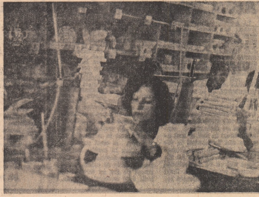
Tinerii de la „Porțelanul”-Alba Iulia au „pe ordinea de zi” realizarea unor importante economii de barbatină și pastă de fasonat, decoloranți și metale prețioase