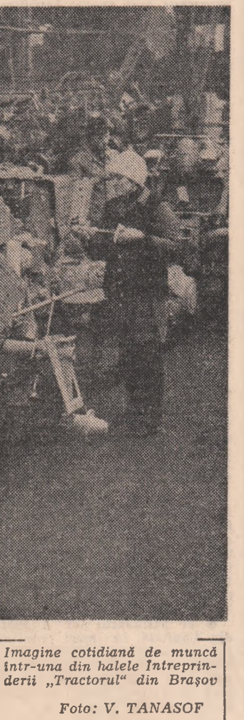
Imagine cotidiană de muncă într-una din halele întreprinderii „Tractorul” din Brașov.