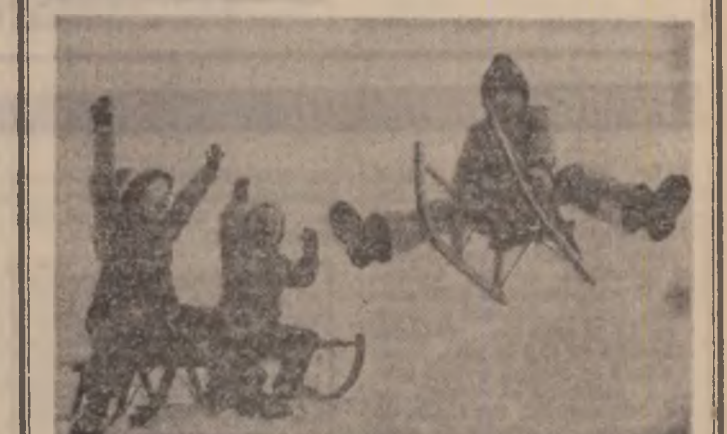
Zboară, zboară, zboară sămănoară...