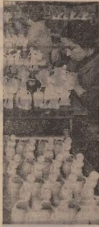
La întreprinderea „Portelanul” din Curtea de Argeș.