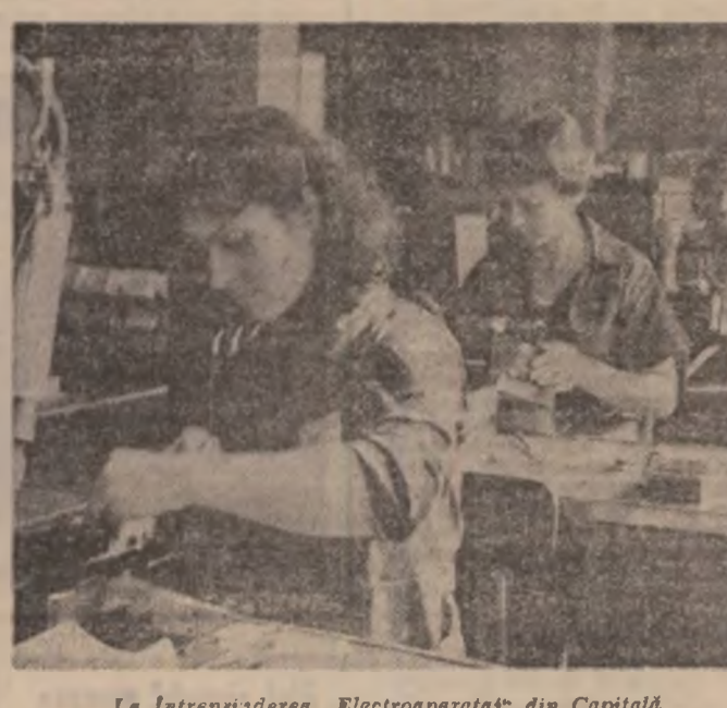
La întreprinderea „Electroaparataj“ din Capitală.