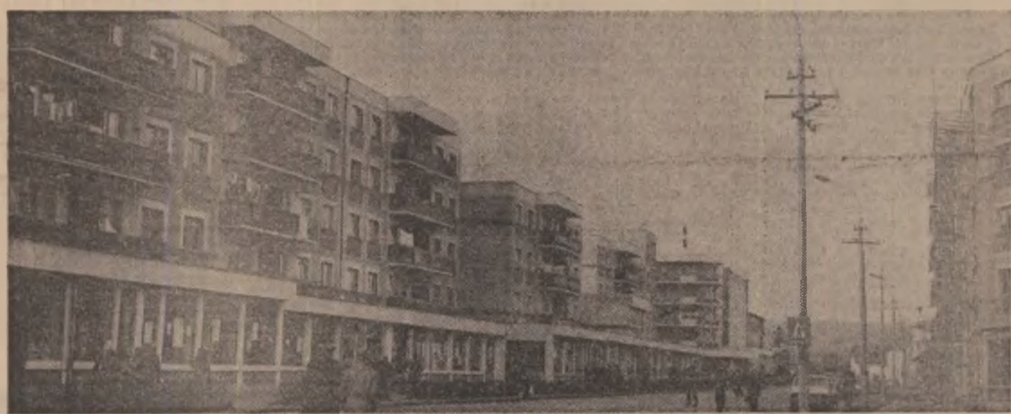
Imagine din Topoloveni, județul Argeș