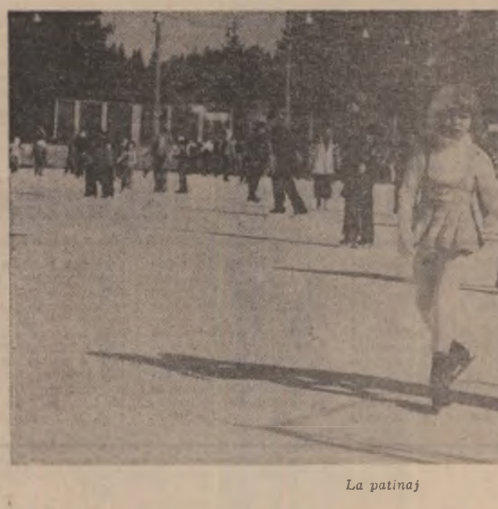
La patinaj