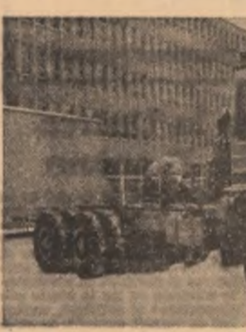
Primul model '82

— Noi, maeștrii, avînd în vedere eficiența deosebită a acestor inițiative, ne-am angajat să asigurăm asistența tehnică, ne spunea tînarul Tănase Drutu, de la secția I. Pină acum am realizat lucrări de sudură, de confecționat și asamblat blocurile, de vopsitorie etc. Deși se desfășoară după orelle de program, activitatea este bine organizată și programată pe zile, decada și luni, astfel încît avem certitudinea realizării obiectivelor propuse.