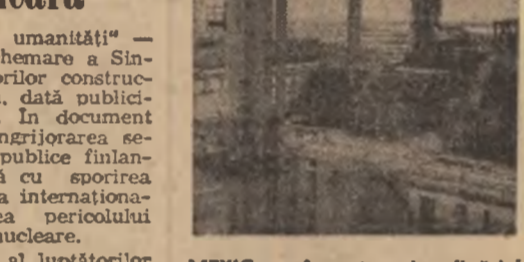
MEXIC — Aspect al rafinării Minatitlan, cea mai mare fabrică de producție zilnică de 300 000 barili