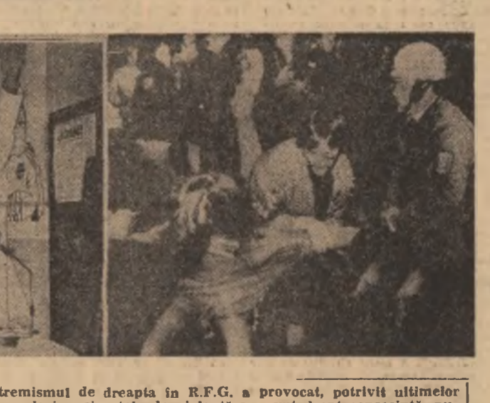
De la 1 septembrie 1978, extremismul de dreapta în R.F.G. a provocat, potrivit ultimelor statistici, 19 morți. Atentatele cu explozive și acțele de violență au avut drept consecință, numai în ultimii trei ani, rănirea a 233 de persoane. 631 extremiști de dreapta au fost condamnați pentru faptele lor, alți 97 sînt în curs de judecare, 20 dintre extremiștii de dreapta se află în prezent în închisoare.

Statisticile relevă că 69 la sută dintre membri ai mai puțin de 30 de ani iar 39 la sută dintre cei mai tineri au participat la 559 acțiuni criminale neo-naziste petrecute între 1976 și 1981. Comentînd aceste date, „Bremer Nachrichten“ subliniază faptul că partidele de extrema dreapta și sloganurile acestora găsesc o rezonanță deosebită în rândul unei părți reduse numeric de tineri, ale căror opinii politice sînt încă destul de confuze. Ceea ce a fost „la buiză“ de adulți solidarizează tinerii aflați în căutarea unei identități autentice, care să le dea sentimentul plener al participării la viața social-politică. „Tineretul vest-german este pesimist, nemulțumit, se îndoiește din ce în ce mai mult că partidele politice sînt cu adevărat capabile să își apere interesele și să îl ia în serios neliniștile“ — comenta Gabrielle Grenz, de la France