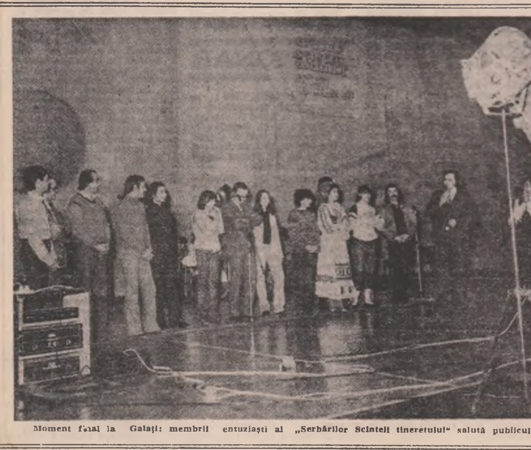
Moment fial la Galați: membrii entuziaști ai „Serbărilor Științei tineretului” salut public

Pagină realizată de CONSTANTIN STAN EUGEN MIHĂESCU