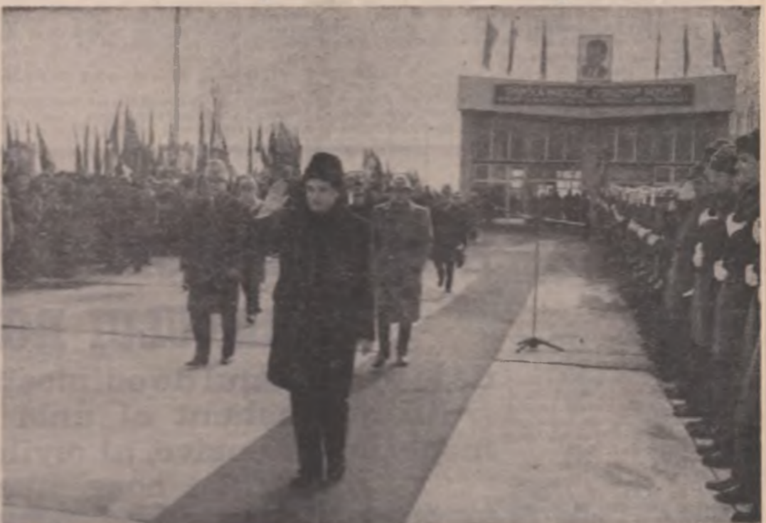
Tovarășul Nicolae Ceaușescu, secretar general al Partidului Comunist Român, prezidentul Republicii Socialiste România, s-a înapoiat duminică în Capitală, venit de la Timișoara, unde s-a întâlnit cu tovarășii Dusan Dragosavac, președintele Prezidiului Comitetului Central al Uniunii Comunistilor din Iugoslavia, care, la invitația secretariatului general al P.C.R., a efectuat în fruntea unei delegații a U.C.I. o vizită de prietenie în țara noastră. Tovarășii Nicolae Ceaușescu și Dusan Dragosavac au avut o convorbire în sala de conferințe a Prezidiului Comitetului Central al Uniunii Comunistilor din Iugoslavia, în care s-a discutat despre colaborarea și prietenia dintre țările și popoarele noastre. La ieșirea din Timișoara, tovarășii Nicolae Ceaușescu și Dusan Dragosavac au fost salutati de o delegație a U.C.I. în fruntea căreia se aflau: secretarul al Comitetului Județean Timiș al P.C.R., de reprezentanți ai organelor locale de partid și de stat. Pe aeroport se aflau mii de timișoreni, care au făcut secretarului general al partidului o entuziastă manifestație de dragoste și prețuire, în care și-au găsit expresie bucuria de a fi avut din nou ca oaspete drag și sumat pe tovarășul Nicolae Ceaușescu, satisfacția pentru noul dialog româno-iugoslav la nivel înalt, menit să contribuie la extinderea și întărirea continuă a relațiilor de prietenie și bună vecinătate dintre țările și popoarele noastre. O gardă alcătuită din ostași ai forțelor noastre armate, din membri ai găzilor patriotice și ai detașamentelor de pregătire a tineretului pentru apărarea patriei a prezentat onorabilului secretar al Comitetului Județean Timiș al P.C.R., de reprezentanți ai organelor locale de partid și de stat. Pe aeroport se aflau mii de timișoreni, care au făcut secretarului general al partidului o entuziastă manifestație de dragoste și prețuire, în care și-au găsit expresie bucuria de a fi avut din nou ca oaspete drag și sumat pe tovarășul Nicolae Ceaușescu, satisfacția pentru noul dialog româno-iugoslav la nivel înalt, menit să contribuie la extinderea și întărirea continuă a relațiilor de prietenie și bună vecinătate dintre țările și popoarele noastre. O gardă alcătuită din ostași ai forțelor noastre armate, din membri ai găzilor patriotice și ai detașamentelor de pregătire a tineretului pentru apărarea patriei a prezentat onorabilului secretar al Comitetului Județean Timiș al P.C.R., de reprezentanți ai organelor locale de partid și de stat.