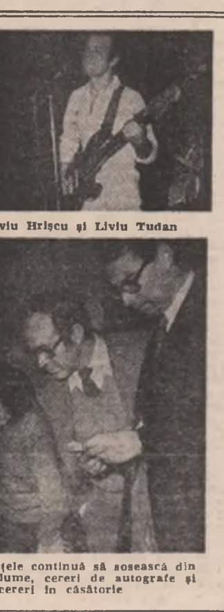
Zeci și zeci de bilete continuă să sosescă din sală. Întrebări, glume, cereri de autografe și chiar... cereri în căsătorie