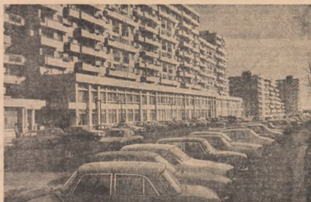
Cine n-a văzut Piteștiul demult, să nu se aștepte să-l mai recunoască. El a devenit un oraș al tinereții.

din cadrul unităților respective. Au fost înscrise în acest registru 300 tone metal, 380 tone laminate oțel, 1.400 MgW, 70 tone motorină, 150.000 m.c. de abur, 540.000 m.c. de apă, 900 m.c. de gaz metan. Utilizarea deșeurilor s-a situat la un nivel mult crescut (cu 45-50 la sută) față de anul 1980. „Din deșeurii — produse noi” s-a numit inițiativa de economisire a materialelor și materiilor prime la I.M.M., Combinatul de Hantii Cimpulung, la C.L.C., acțiunea finalizându-se cu 300 de reperi din deșeurii metalice, reducerea normelor de consum de la 114 kW pe tonă de ciment (cât era în 1980) la 111 kW/tonă de ciment, valoarea recuperărilor, recondiționării, refolosirii unor piese și subsansamblu a fost de 9 milioane lei. „Trofeul calității și productivității muncii” — impus de tinerii de la I.A.P., C.P.L., Argeșana, Textila a condus la mărirea productivității muncii cu 2 la sută și la un indice de utilizare a fondului de timp mai mare cu 20 la sută. Sinteticele din realizările uitate în domeniul economiei, realizări la care trebuie să adăugăm activitatea tehnico-stilistică, creațiile tinerilor care nu vizează altceva decât tot același lucru: a produce mai bine, mai repede, mai ieftin. Ea se înscrie ca una din acțiunile de prestigiu ale organizației județene Argeș a U.T.C.