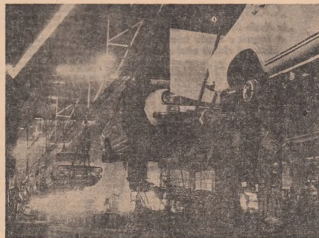
Dacia este un autoturism tineresc, se spune și nu fără temei. Pentru că în mare măsură tinerii îl realizează.

petrochimic și la Combinatul de prelucrare a lemnului. Legarea învățămîntului de practică și-a dovedit eficiența în cercetare și creație tehnică, astfel că la cea de-a 15-a conferință ale cercurilor științifice studentești, studenții argeși au dobîndit 8 premii. Două locuri III (dansuri populare și soliști instrumentiști muzicali populari) la festivalul artei studentești dovedesc că indiferent că sint din deceniu la calitate și eficiență.