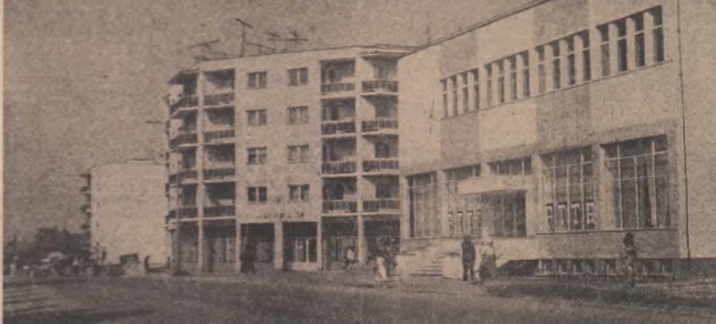
Se îmbogățeste zestrea edificată a Jiboului cu noi și frumoase construcții.

Trosăm, într-un fel, o diagonala revoluționară, de la o legătură între două județe, între două organizații județene ale Uniunii Tineretului Comunist sub auspiciile muncii și romonismului revoluționar — VASLUI și TIMIS. Trosăm o linie de legătură prin puterea și trînciua foptelor, prin unitatea de gînd și aspirație a acestui timp istoric ce ne delinște și ne exprimă, și pe care, la rîndu-ne, îl definim și îl desemnăm prin tot ce-avem mai bun și mai frumos, iar tot ce-avem mai bun și mai frumos înseamnă muncă, dăruire revoluționară, abnegație patriotică, înaltă angajare civică puse în slujba celor mai luminoși ideal care-o stă vazădă în tota tinereții generații, idealul propășii și progresului patriei, idealul muncii pentru noi, pentru țară, idealul comunist. Prezentăm, în PAGINA A III-A a numărului nostru, într-un portret-crochiu cîteva date, date de muncă și aspirație, delinșind cele două organizații revoluționare de tineret.