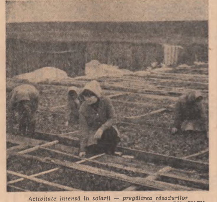
Activitate intensă în solarii — pregătirea răsădurilor.

Complexitatea lucrărilor ce se desfășoară primăvara în agricultură impune o riguroasă organizare a activității lucrătoare formatorilor de muncă din S.M.A., I.A.S., C.A.P., asociații și societăți legumicole, pomologice sau zootehnice. Facem această remarcă deoarece, pe lângă activitatea de acum se desfășoară cea mai importantă lucrare a actualilor campanii — semănatul, o activitate de mare importanță în zootehnie pentru realizarea producțiilor anuale, de lucrări din sere, răsădit și solarii de tăierile și stropirile din livezi și plantațiile viticole, de lucrări ameliorative desfășurate pe pașji și pășuni, de pregătirea utilajelor, semintelor și a celorlalte materiale necesare însemnărilor la principalele culturi ale primăverii — sfeclă de zahăr, cartofi, porumb, floarea-soarelui, plante furajere. Numai și prin această trecere sumară în revistă a celor mai importante lucrări din perioada de primăvară ne putem crea o