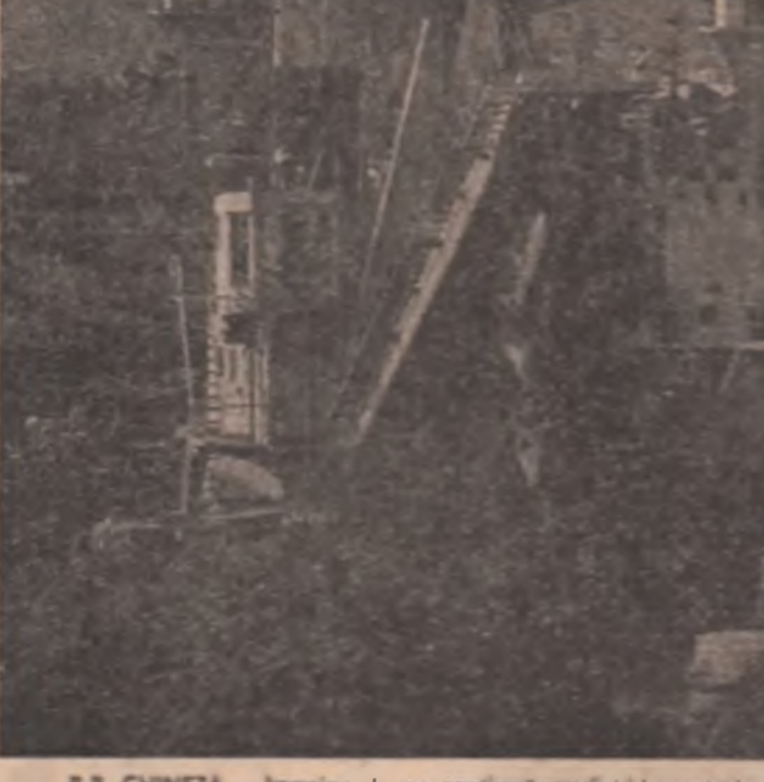
R.P. CHINEZA - Imagine de pe zborul mării hidrocentrale Gezhouba, pe râul Yangzi