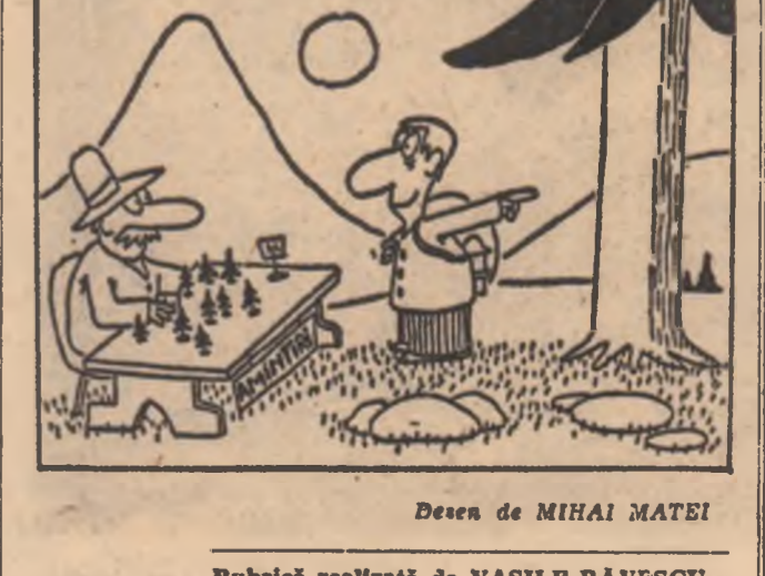
Rubrică realizată de VASILE RĂVESCU