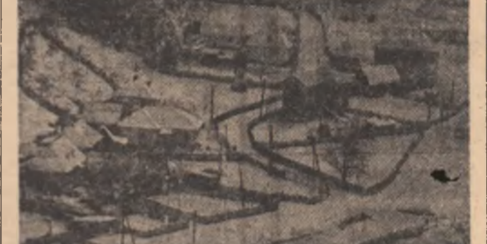
Pe Lotru, la Voineasa, iarna este încă în vigoare