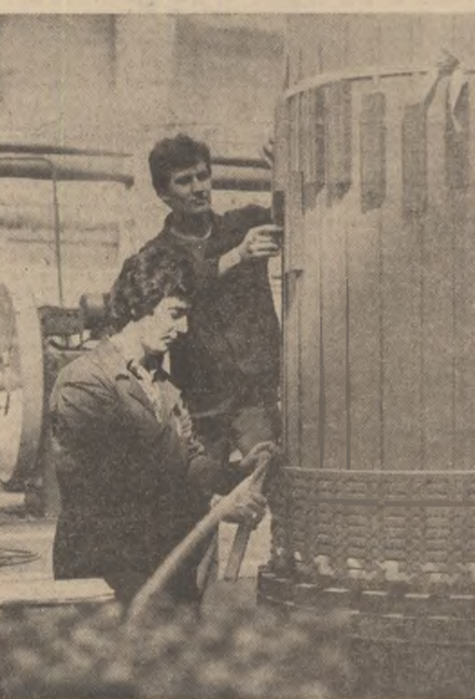
Forța fabricii de transformatoare mari de la „Electroputere” Craiova o constituie tinerii