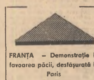
FRANȚA — Demonstrație în favoarea păcii, desfășurată la Paris

...să înceapă negocierile pentru aderarea la C.E.E. în luna ianuarie a anului 1980. În prezent, negocierile sunt în curs și se așteaptă să se finalizeze în cursul lunii februarie. Membrii C.E.E. au hotărât să înceapă negocierile pentru aderarea la C.E.E. în luna ianuarie a anului 1980. În prezent, negocierile sunt în curs și se așteaptă să se finalizeze în cursul lunii februarie.