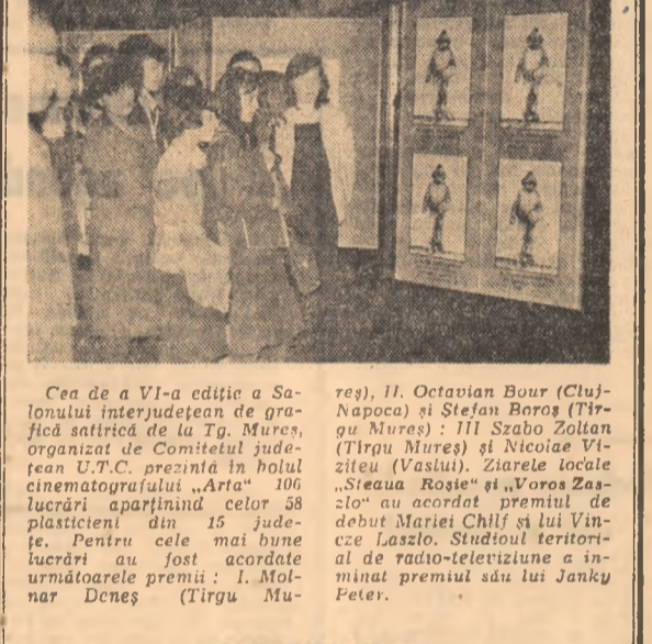
Cea de a VI-a ediție a Săptămânii Interjudețene de grație...