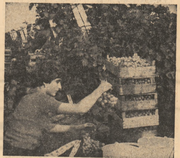
Tineretea viilor se măsoară acuma și în strata muncii uteciștilor