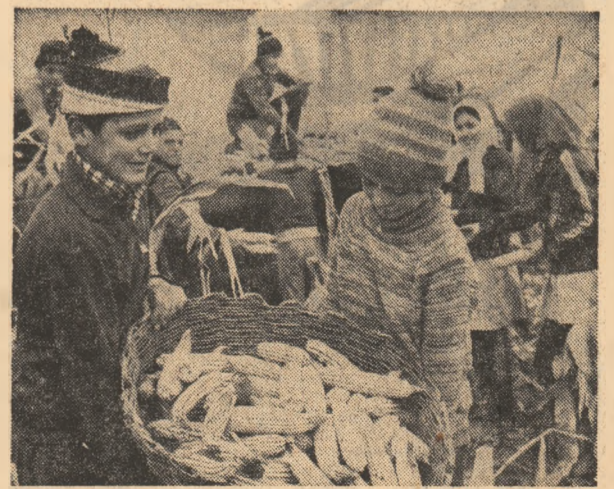
Porumbul (multi) cere (și are) hîrnicie pe măsură