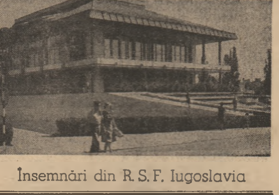
Insemnări din R.S.F. Iugoslavia