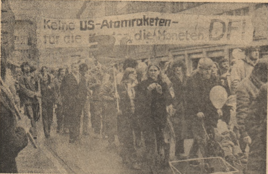
R.F. GERMANIA : Aspect de la o amplă demonstrație a populației pentru pact, împotriva cursei inarmărilor

Cu prilejul celei de a 65-a aniversări a Marii Revoluții Socialiste din Octombrie