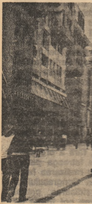
Cultura de...