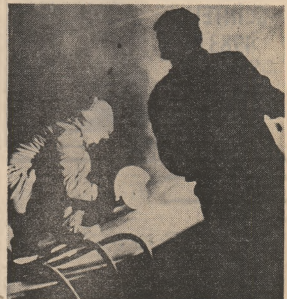
Întreprinderea de utilaj chimic „Grivița Roșie”

Întreprinderea de matrițe și piese de schimb din municipiul Odorheiu Secuiesc este a 15-a unitate economică din județul Harghita care anunță îndeplinirea înaintea termenului a sarcinilor de plan pe întregul an. Construcția de mașini și de matrițe de aici vor realiza, până la finele lunii, un spor de producție de peste 40 milioane lei, materializat într-o largă gamă de utilaje, piese de schimb și matrițe destinate unor importante sectoare ale economiei naționale. Unitățile harghitene care au consemnat acest succes vor înregistra până la sfîrșitul anului un spor de producție marî de peste 200 milioane lei.