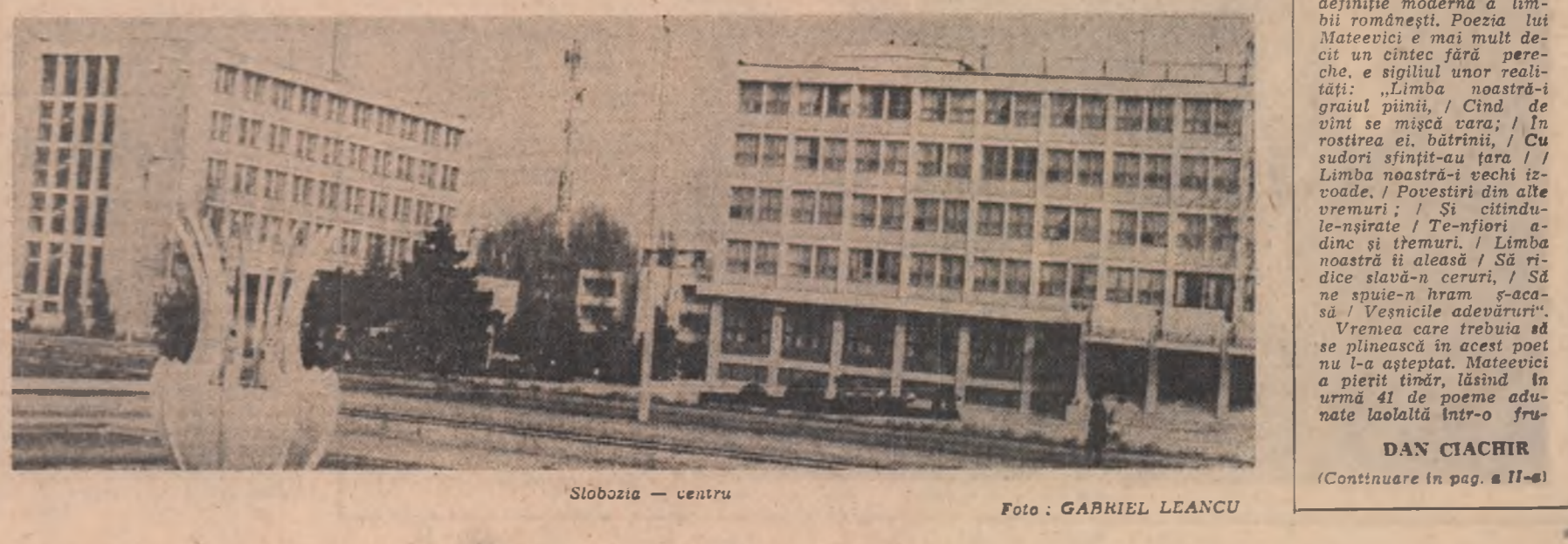
Slobozia — centru

CORNEL NISTORESCU (Continuare în pag. a 11-a)