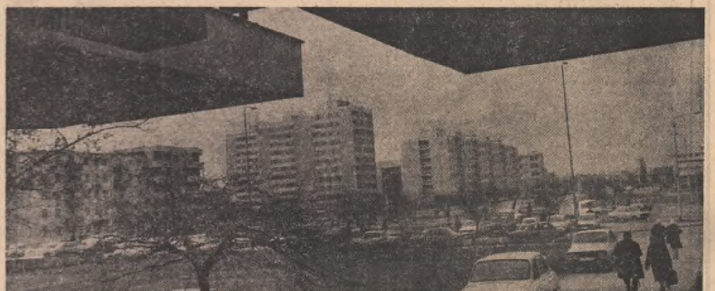
Noi construcții de locuințe în municipiul Timișoara