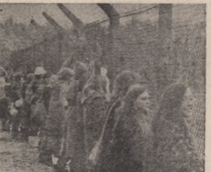
Aspect din timpul uneia dintre numeroasele acțiuni organizate de femeile britanice împotriva preconizatei instalări a rachetelor nucleare americane pe teritoriul țării lor

BUDAPEȘTA 27 (Agerpres) — În cadrul Lunii păcii și prieteniei la Budapeșta a avut loc un simpozion pentru pace al reprezentanților culturii — înfărmăză agenția M.T.I. Luidin convins cu acest prilej, Frigyes Posa, ministrul afacerilor externe al R.P. Ungare, a prezentat principalele direcții ale politicii guvernului său în lupta împotriva cursei înarmărilor, de colaborare cu țările socialiste, de extindere a relațiilor economice, politice și culturale cu statele neutre și nealiniate, precum și ideea capitalizării dezoilate. El a subliniat că țara să răzumieste ca, prin dialog și tratative, să contribuie la reglementarea pasnică a problemelor internaționale stringente. Participanții la mișină au evidențiat că, slături de toate forțele lubitoare de pace din lume, poporul ungar se pronunță pentru preîntîmpinarea unui război nuclear și utilizarea întregului potențial uman și material al planetei în scopul prosperității omnilor.