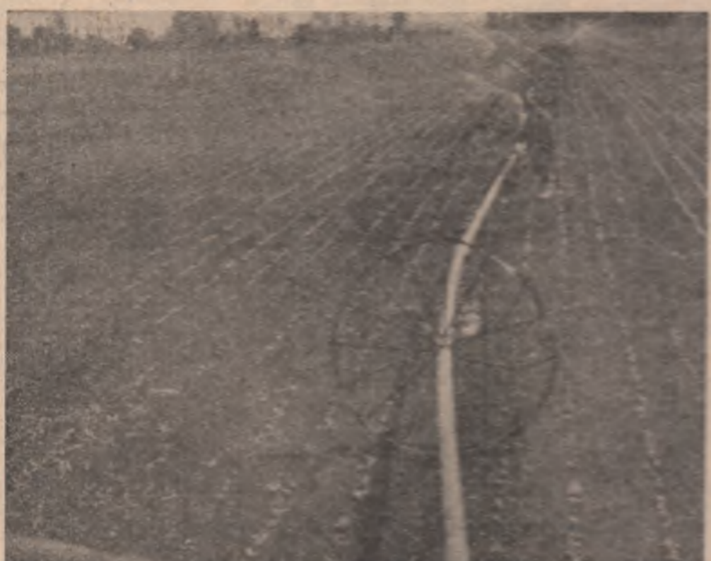
Zi și noapte, udările trebuie continuate cu maximă intensitate

Fiecare zi, fiecare oră, întreaga forță de muncă a satului folosite din plin pentru efectuarea optimă și de calitate a lucrărilor de sezon