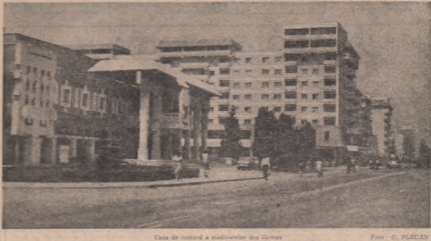
Casa de cultură a studenților din Romaș

Primirea carnetului de membru al Uniunii Tineretului Comunist, moment cu profunde semnificații în viața unui tânăr