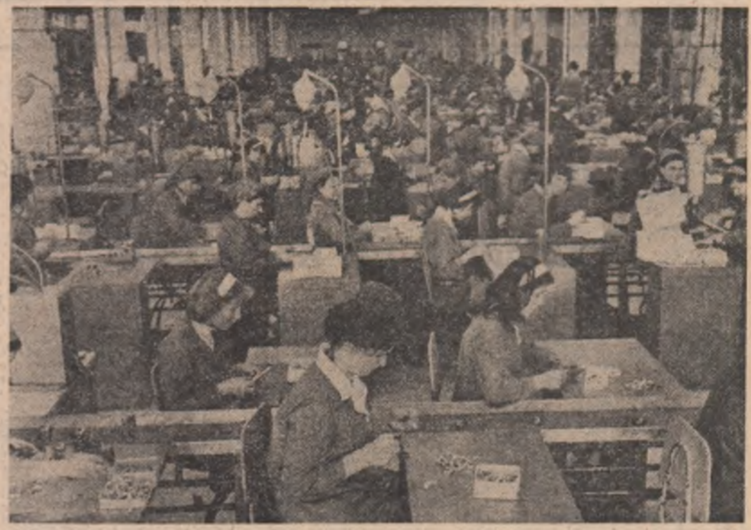
Imagine de la I.A.E. Titu